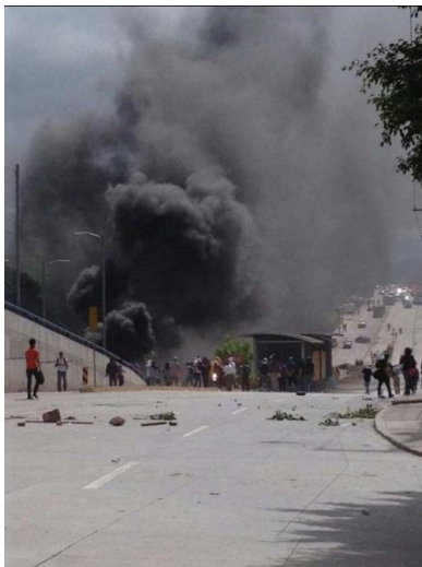
Foto 1. Toma de carretera en La Lima, Cortés.

Foto 2. Toma en la colonia Centroamérica Oeste, Comayagüela.