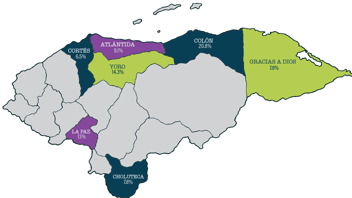
Mapa 1. Departamentos con mayor concentración de conflictividad socioterritorial registrada